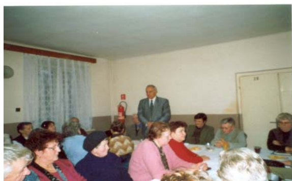
Ustanovujúce zasadnutie klubu dôchodcov