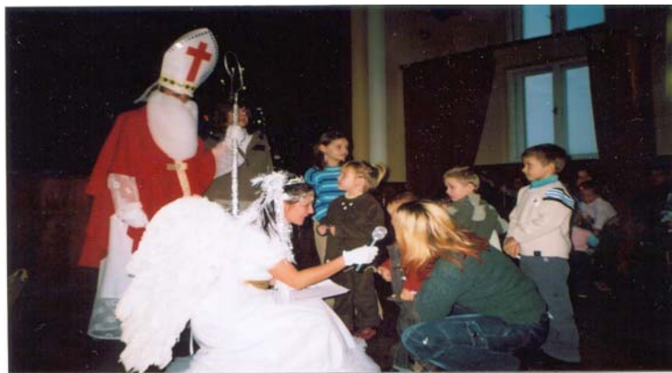
Stretnutie s Mikulášom