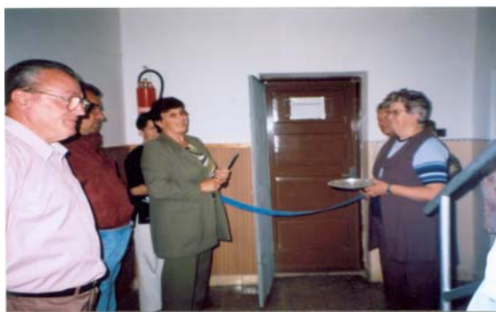
Otvorenie klubu dôchodcov

Plán činnosti Jednoty dôchodcov je rozčlenený na tri hlavné oblasti – spoločenskú, vzdelávaciu, záujmovú. V oblasti spoločenskej sme zatiaľ uskutočnili dve slávnostné posedenia pri príležitosti Medzinárodného dňa žien a Mesiaca úcty k starším, dva jednodňové výlety s cieľom poznávania našej národnej histórie. S príchodom jari sme iniciovali celoobecnú akciu na zveľadenie životného prostredia s názvom „Čistá obec – zdravá obec.“ Túto myšlienku sme podporili i symbolický sadením stromčekov ginka dvojlaločného v areáli základnej školy pod heslom „Senior – strom porozumenia, nádeje a viery v dôstojný a plnohodnotný život dôchodcov.“