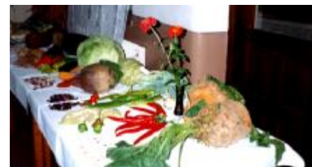
Z výstavy zeleniny vo Svinnej

Záver roka by mali vyplniť divadelné predstavenia, a to jednak dospelí, ktorí by chceli nadviazať na staré tradície a aktivizovať sa bude aj detský divadelný súbor Plamienok, ktorého členovia sa verejnosti pravdepodobne predstavia, tak ako zvyčajne, počas vianočných, prípadne novoročných sviatkov.